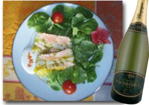
A déguster avec notre Champagne Cuvée de Réserve Brut